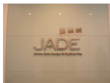
ジェイドエンジニアリング