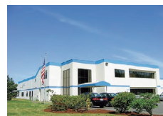
ジャムコアメリカ