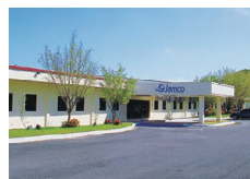
ジャムコフィリピン