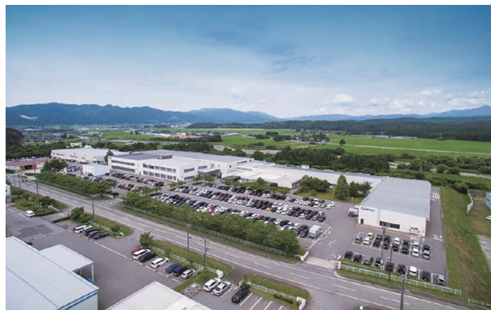
ジャムコエアクラフトインテリアズ 新潟工場

会社名 株式会社ジャムコ 本社 東京都立川市高松町1丁目100番地 創立 1955年9月1日 伊藤忠航空整備株式会社創立 1970年6月16日 新日本航空整備株式会社に商号変更 1988年6月29日 株式会社ジャムコに商号変更 資本金 5,359,893千円 主な株主 伊藤忠商事株式会社 ANAホールディングス株式会社 昭和飛行機工業株式会社 従業員 2,692名 (単体:1,059名)